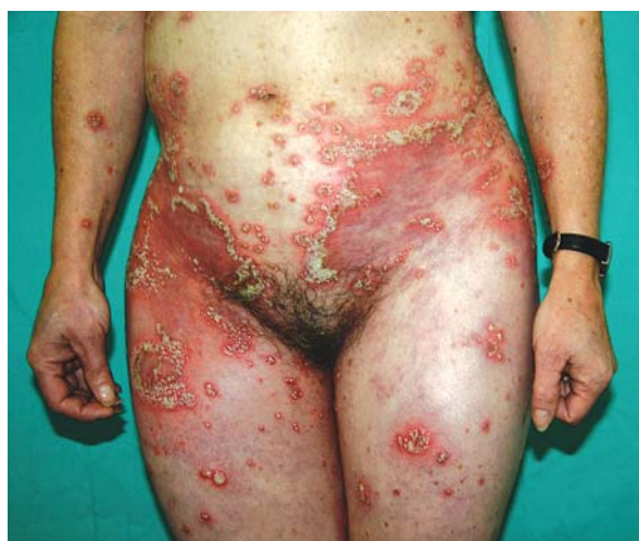
Ryc. 2. Zmiany krostkowe na podłożu rumieniowym szczególnie nasilone w fałdach pachwinowych

Fig. 1. Disseminated pustular lesions on erythematous background forming annular figures