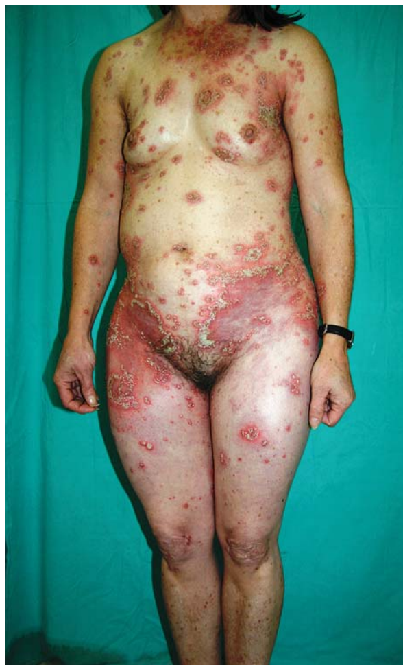
Ryc. 1. Rozsiane zmiany krostkowe na podłożu rumieniowym z tendencją do obrączkowego układu

Po zastosowaniu dożylniej steroidoterapii zaobserwowano szybką regresję zmian krostkowych i rumieniowo-obrzękowych o charakterze erythema iris . Poprawie stanu miejscowego towarzyszyło ustąpienie obrzęków podudzi oraz stopniowa normalizacja